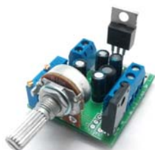
Общий вид устройства

Регулировка частоты ШИМ управления позволит полностью убрать гул обмоток двигателя, а встроенная защита ограничит превышение рабочего тока.