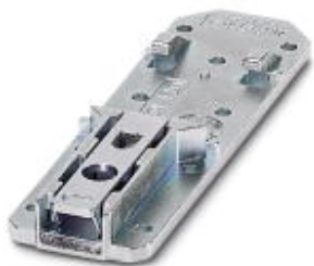
Универсальный адаптер для монтажной рейки

Обратите внимание на то, что приведенные здесь данные взяты из online-каталога. Полная информация и данные содержатся в документации пользователя. Действуют Общие условия использования для информации, загруженной из интернета. ( http://phoenixcontact.ru/download )