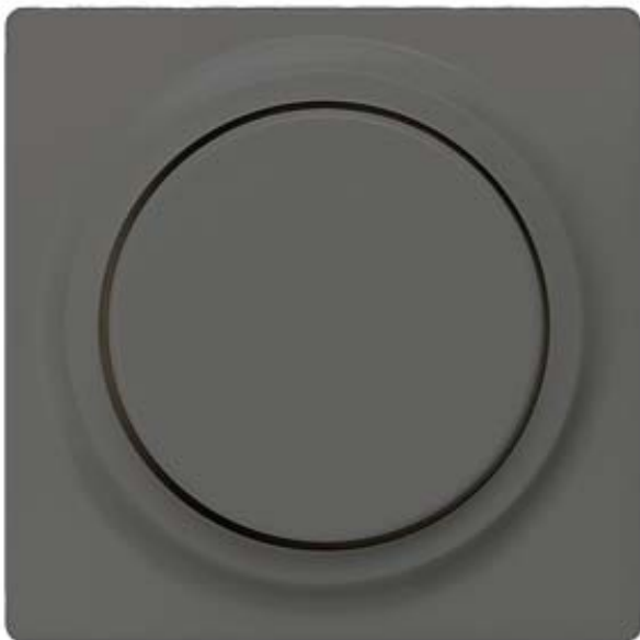
I-SYSTEM, CARBON METALLIC COVER PLATE F. DIMMER W. ROTARY BUTTON 55X55MM